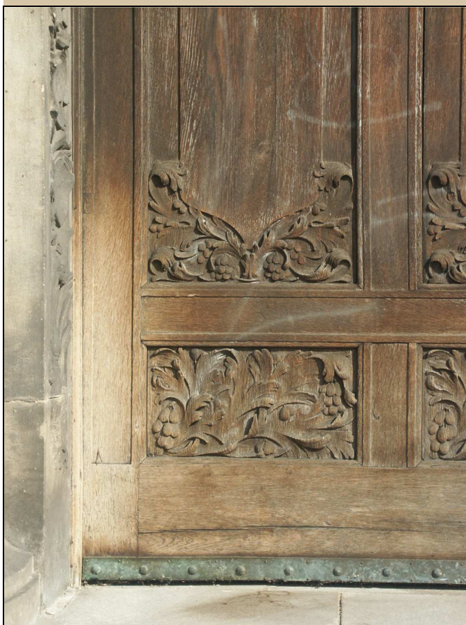
detail z dveřního křídla