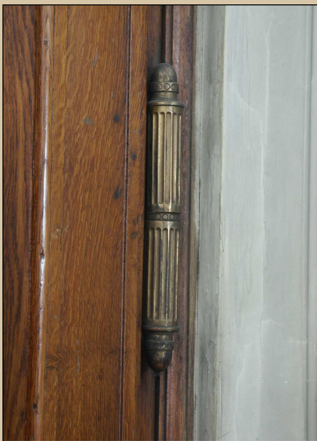
kanelované dveřní závěsy s žaludovými konci