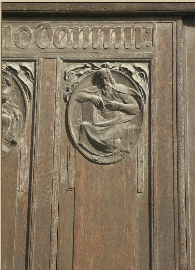
detail z dveřního křídla