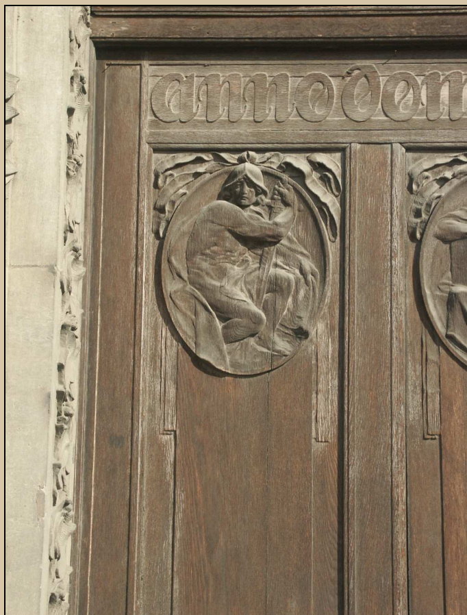
detail z dveřního křídla