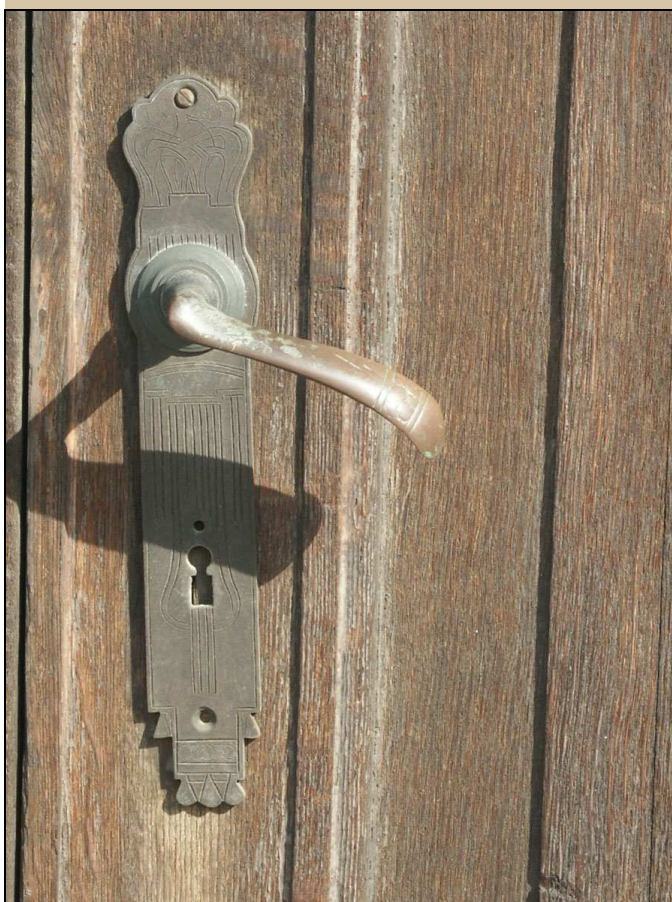
původní klika se secesním štítkem